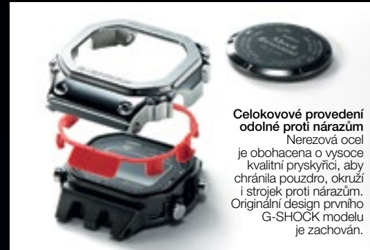
GMW-B5000GD-1ER | 14 990 Kč*