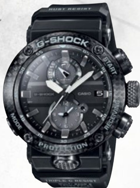
GWR-B1000-1AER | 21 690 Kč*