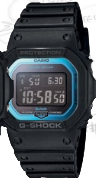
GW-B5600-2ER | 3 790 Kč*