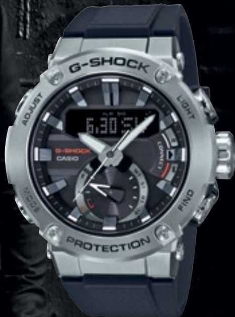
GST-B200-1AER | 7 490 Kč*