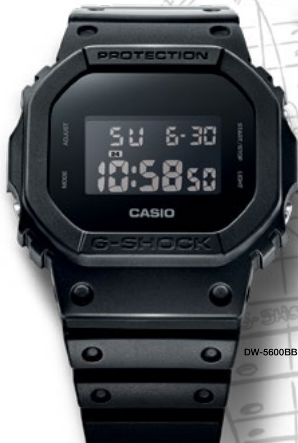
DW-5600BB-1ER | 2 490 Kč*