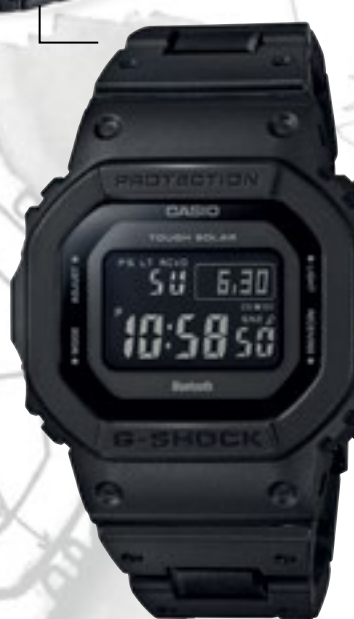
GW-B5600BC-1BER | 5 590 Kč*