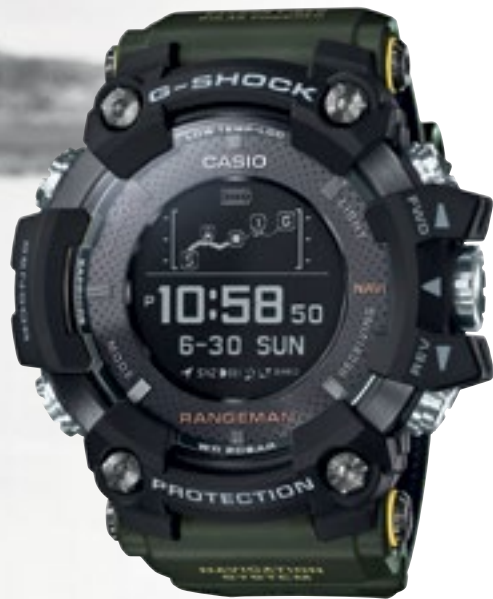
GPR-B1000-1BER | 21 990 Kč*