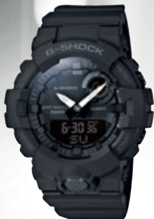
GBA-800-1AER | 3 290 Kč*