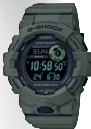
GBD-800UC-3ER | 2 790 Kč*