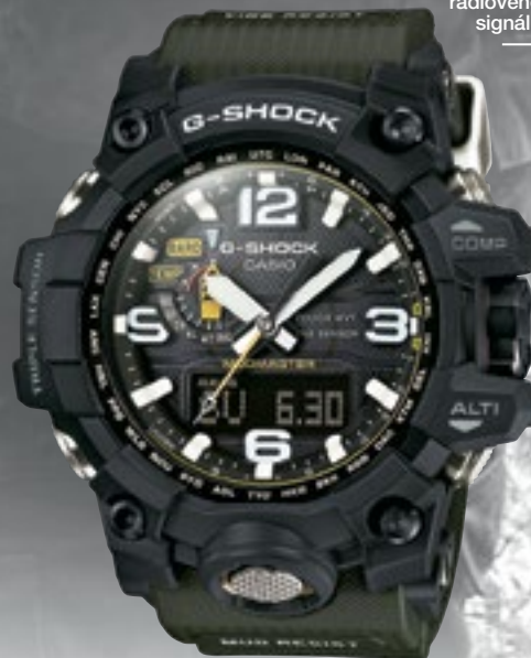
GWG-1000-1A3ER | 19 490 Kč*

Pouzdro odolné vůči nečistotám | funkce světového času odpočítávací stopky | stopky | super automatické LED osvětlení minerální sklo | digitální kompas | teploměr | nárazuvzdorné vodotěsné až do 20 bar