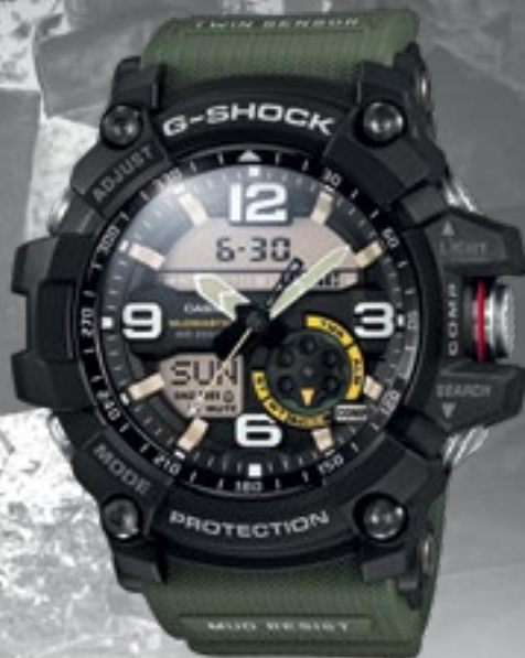
GG-1000-1A3ER | 7 990 Kč*

Navíc se solárním napájením a příjmem rádiového signálu