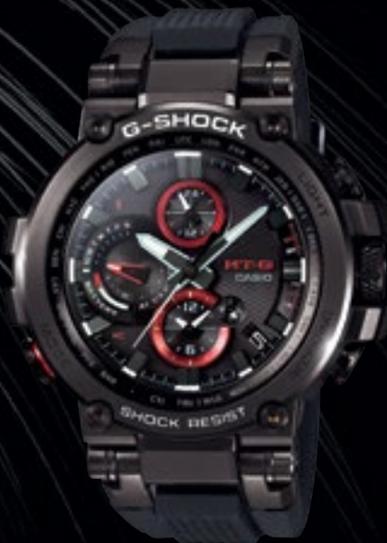
MTG-B1000B-1AER | 24 490 Kč*