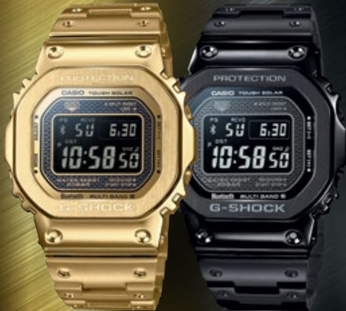
GMW-B5000GD-9ER | 14 990 Kč*