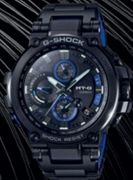
MTG-B1000BD-1AER | 26 990 Kč*