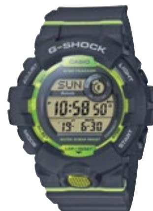
GBD-800-8ER | 2 790 Kč*