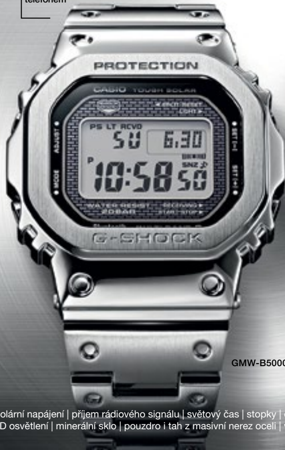
GMW-B5000D-1ER | 13 490 Kč*

Snadné nastavení díky propojení s chytrým telefonem