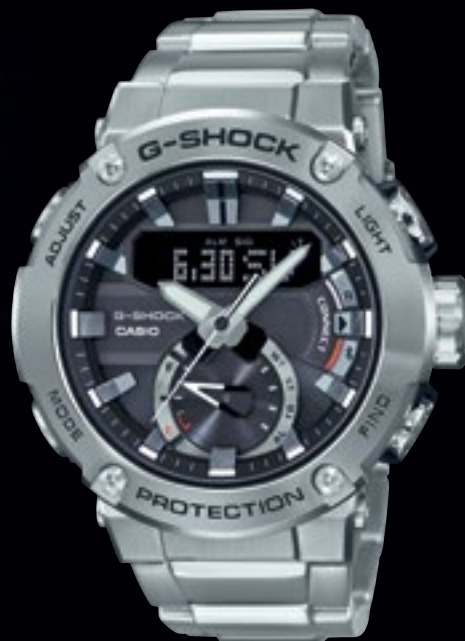
GST-B200D-1AER | 9 490 Kč*

solární napájení | příjem rádiového signálu | funkce světového času | odpočítávací stopky | stopky | nárazuvzdorné | plně automatické LED osvětlení | Neo displej | minerální sklo | pouzdro z ušlechtilé oceli a pryskyřice | vodotěsné až do 20 bar