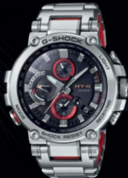
MTG-B1000D-1AER | 24 490 Kč*