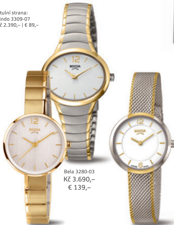
Bela 3280-03 Kč 3.690,- € 139,-

titulní strana: Lindo 3309-07 Kč 2.390,- | € 89,-