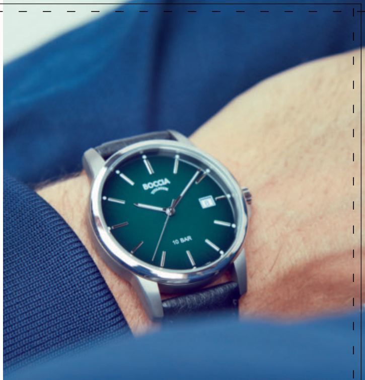
na fotografii: Pabor 3633-02 | safírové sklo | Kč 2.690,- | € 99,-