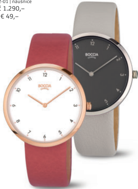
Lindo 3309-05 | Lindo 3309-08 | Lindo 3309-07 (titulka) Kč 2.690,- | Kč 2.390,- | Kč 2.390,- € 99,- | € 89,- | € 89,-

náhrdelník 08014-02 titan, potažené zlatem /// přívěs 07021-03 titan, potažené růžovým zlatem /// náhrdelník 0802-01 nerezová ocel /// náušnice 05027-01 titan /// náušnice 05022-01 titan /// náušnice 05023-02 titan, potažené zlatem /// náušnice 05024-03 titan, potažené růžovým zlatem /// náhrdelník 08033-02 titan, částečně potažené růžovým zlatem /// náušnice 05042-01 titan /// náramek 03029-02 titan, částečně potažené růžovým zlatem /// náramek 03030-01 titan /// Lindo 3309-05 titan, potažené růžovým zlatem, 3 bary, kožený pásek /// Lindo 3309-08 titan, 3 bary, kožený pásek /// Uvedené ceny jsou doporučené maloobchodní ceny.