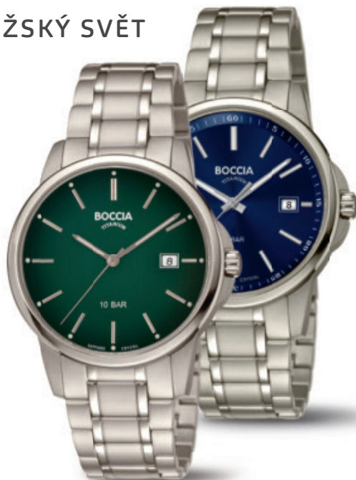
Pabor 3633-05 | safírové sklo | Pabor 3633-04 | safírové sklo Kč 2.690,- | Kč 2.690,- € 99,- | € 99,-

Bukur 3635-02 titan, datumové okénko, 10 barů, kožený pásek /// Bukur 3614-05 titan, potažené modrou barvou, datumové okénko, 5 barů, milánský tah z nerezové oceli /// Bukur 3750-06 titan, pokovaný, datumové okénko, 5 barů, milánský tah z nerezové oceli /// Pabor 3633-05 titan, datumové okénko, 10 barů, titanový pásek /// Pabor 3633-04 titan, datumové okénko, 10 barů, titanový pásek /// Uvedené ceny jsou doporučené maloobchodní ceny.