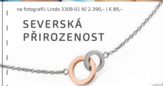
08033-02 | náhrdelník Kč 2.690,- € 109,-