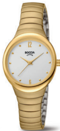
Bela 3307-02 Kč 3.690,- € 139,-

Lindo 3315-02 titan, potažené zlatem, 5 barů, kožený pásek /// Lindo 3315-01 titan, 5 barů, kožený pásek /// Lindo 3315-03 titan, potažené růžovým zlatem, 5 barů, kožený pásek /// přívěs 07024-01 titan /// náhrdelník 0802-01 nerezová ocel /// náušnice 05034-01 titan /// Lindo 3273-11 titan, potažené růžovým zlatem, 3 bary, kožený pásek /// prstýnec 0149-01 titan /// prstýnec 0149-02 titan /// Bela 3307-01 titan, 3 bary, titanový pásek /// Bela 3307-02 titan, potažené zlatem, 3 bary, titanový pásek /// Uvedené ceny jsou doporučené maloobchodní ceny.