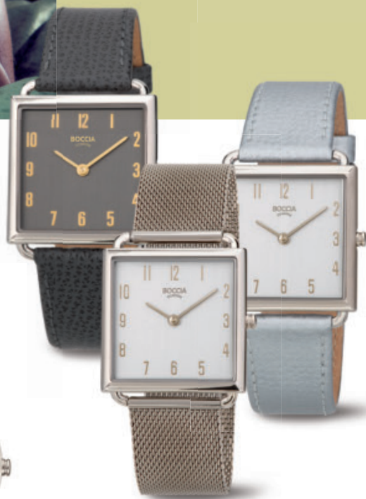
Jonna 3305-03 | Jonna 3305-04 | Jonna 3305-01 Kč 2.690,- | Kč 3.190,- | Kč 2.690,- € 99,- | € 119,- | € 99,-

Trendy pro každý den – od ležérnosti po eleganci.