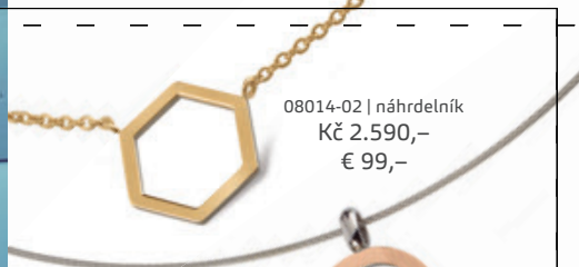
08014-02 | náhrdelník Kč 2.590,- € 99,-