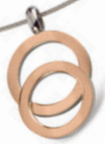
07021-03 | přívěs 0802-01 | náhrdelník Kč 1.490,- | Kč 690,- € 59,- | € 29,-