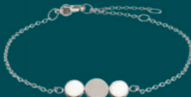
03028-01 | náramek Kč 1.790,- € 69,-