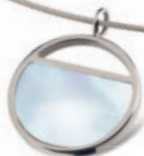
07024-01 | přívěs | perleťový Kč 1.490,- € 59,- 0802-01 | náhrdelník Kč 690,- € 29,-