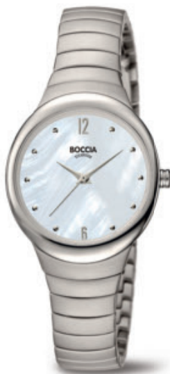
Bela 3307-01 perleťový číselník Kč 3.190,- € 119,-