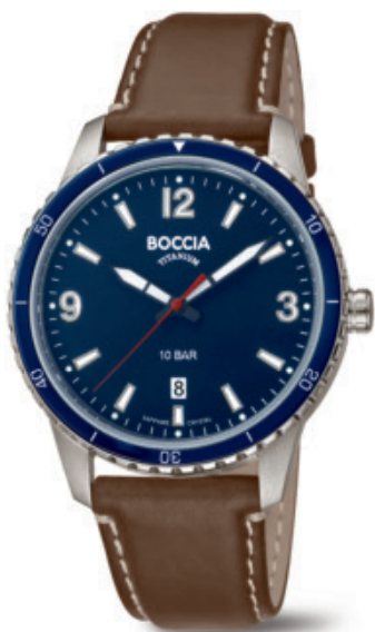
Bukur 3635-02 | safírové sklo Kč 3.690,- € 139,-