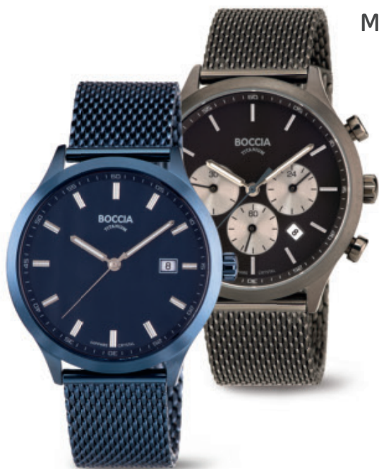
Bukur 3614-05 | safírové sklo Bukur 3750-06 | chronograph | safírové sklo Kč 3.990,- | Kč 4.590,- € 149,- | € 169,-