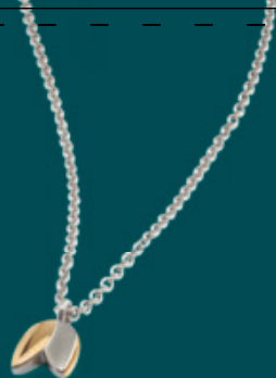
08025-02 | náhrdelník Kč 2.290,- € 89,-