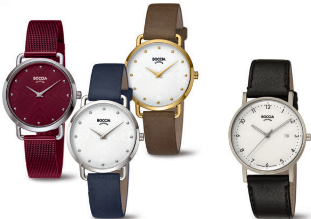
Jonna 3314-05 | Jonna 3314-01 | Jonna 3314-02 Kč 2.690,- | Kč 2.390,- | Kč 2.690,- € 99,- | € 89,- | € 99,-