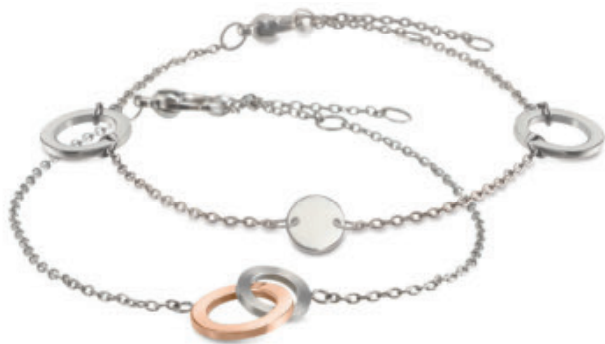
03029-02 | náramek | 03030-01 | náramek Kč 1.990,- | Kč 1.790,- € 79,- | € 69,-