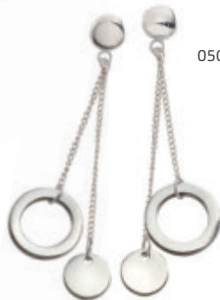
05042-01 | náušnice Kč 1.290,- € 49,-