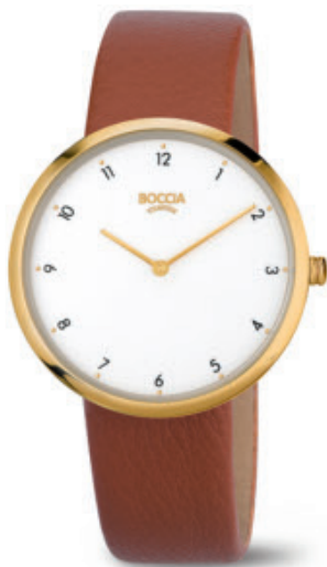
Lindo 3309-06 Kč 2.690,- € 99,-