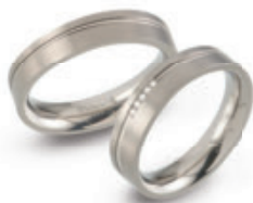
0149-01 | prstýnec | 0149-02 | prstýnec s 5 diamanty 0,025 ct Kč 1.390,- | Kč 3.190,- € 55,- | € 129,-