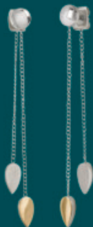
05037-03 | náušnice Kč 1.790,- € 69,-