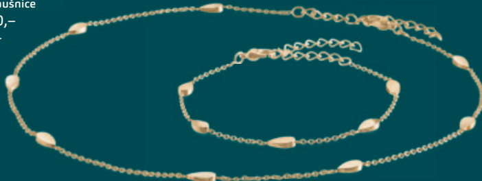
08026-02 | náhrdelník | 03024-02 | náramek Kč 2.990,- | Kč 2.590,- € 119,- | € 99,-

náušnice 05036-02 titan, částečně potažené zlatem /// náhrdelník 08025-02 titan, částečně potažené zlatem /// náušnice 05041-02 titan, potažené zlatem /// přívěs 07025-02 titan, potažené zlatem /// náhrdelník 0802-02 nerezová ocel, potažené zlatem /// náhrdelník 08031-01 titan /// náušnice 05040-02 titan, potažené zlatem /// náramek 03028-01 titan /// náušnice 05037-03 titan, částečně potažené zlatem /// prstýnec 0148-02 titan, částečně potažené zlatem /// prstýnec 0148-01 titan /// náhrdelník 08026-02 titan, potažené zlatem /// náramek 03024-02 titan, potažené zlatem /// Uvedené ceny jsou doporučené maloobchodní ceny. Všechny diamanty jsou pečlivě vsazovány ručně. Velikost na obrázku nemusí odpovídat skutečnosti. Změny vyhrazeny.