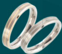
0148-02 | prstýnec | 0148-01 | prstýnec Kč 1.590,- | Kč 1.390,- € 65,- | € 55,-