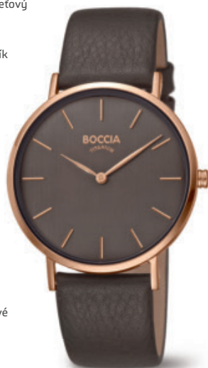
Lindo 3273-11 Kč 2.690,- € 98,-