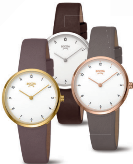
Lindo 3315-02 | Lindo 3315-01 | Lindo 3315-03 Kč 2.690,- | Kč 2.390,- | Kč 2.690,- € 99,- | € 89,- | € 99,-